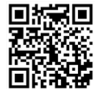
Animierter Trailer zum vorläufigen Produkt

Weitere Informationen und einen animierten Trailer zum vorläufigen Produkt unter www.gravitrax.de